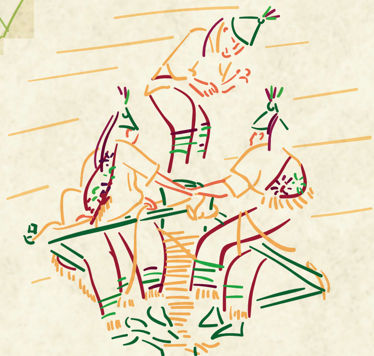
La ceremonia ritual de los Voladores