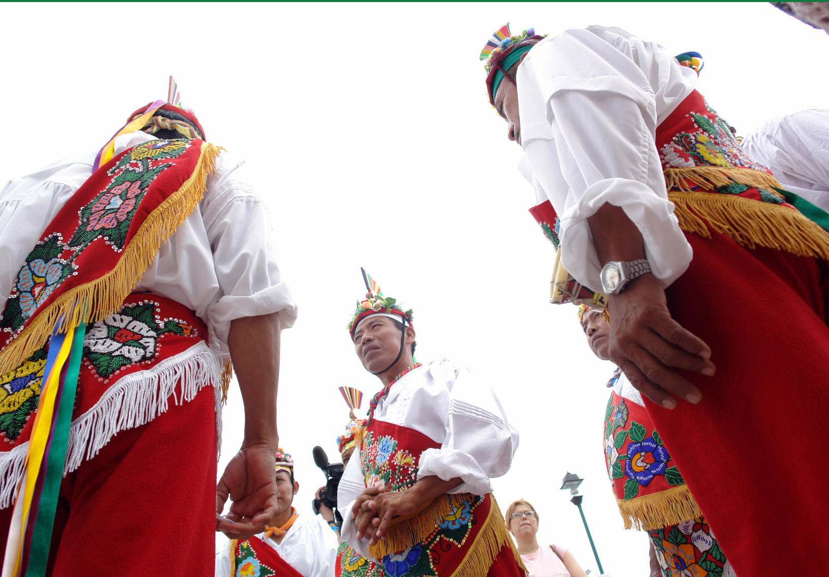
La ceremonia ritual de los Voladores 2008