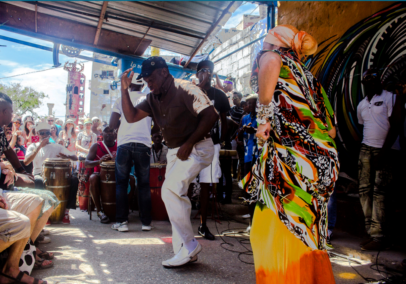
La rumba cubana, mezcla festiva de baile y música, y todas las prácticas culturales inherentes